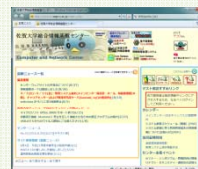
図2: 基盤センターポータル