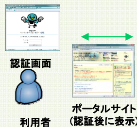
図1: Opengateと連携したシングルサインオンによるサービス提供